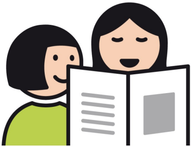
METACOM Symbole © Annette Kitzinger