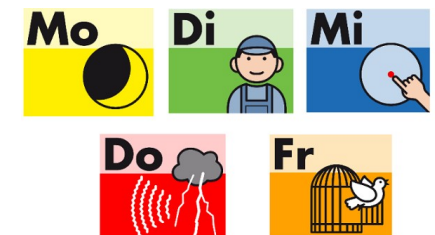
METACOM Symbole © Annette Kitzinger