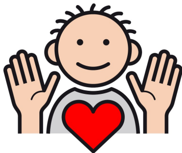
METACOM Symbole © Annette Kitzinger